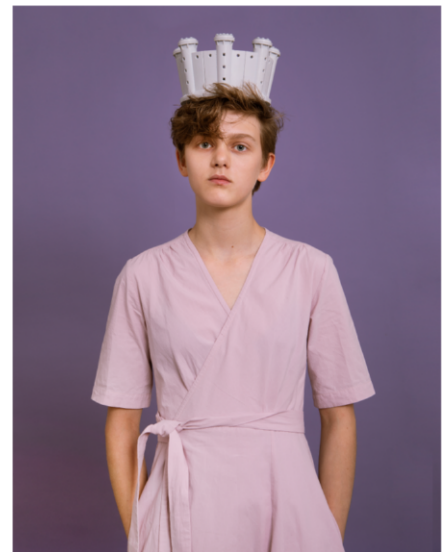
שפת התכשיט, המוזיאון לאמנות האסלאם