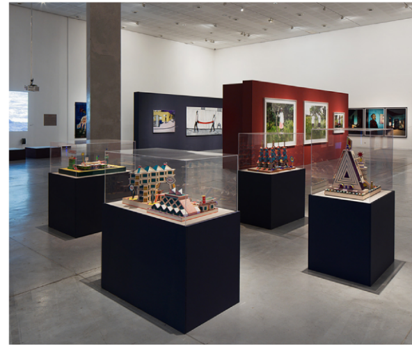
בנוגע לאפריקה, מוזיאון תל אביב לאמנות