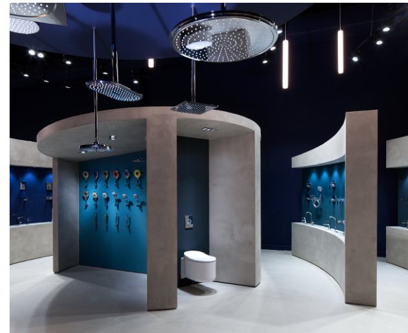
אולם התצוגה והמשרדים של המותג GROHE

כל זאת נעשה ביחס אישי המחויב לכל שלבי העבודה ומתוך מטרה ליצור חלל שלם וחוויה ייחודית הן ללקוח והן למשתמש.